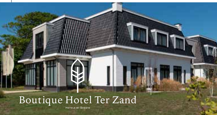
Boutique Hotel Ter Zand

Op een unieke locatie in Zeeland, dicht bij natuurgebied De Zeepe Duinen en het strand van Westerschouwen, vind je sinds circa anderhalf jaar het luxe Boutique Hotel Ter Zand . Perfect om heerlijk te genieten van alles wat de veelzijdige Zeeuwse kust te bieden heeft.