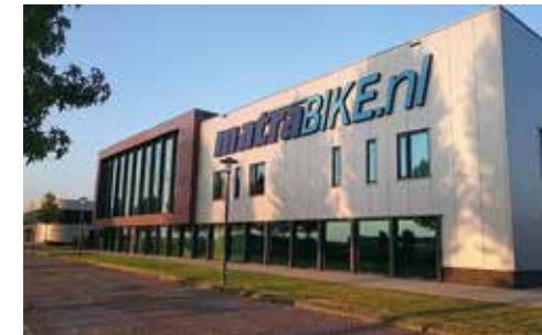
Matrabike Experience Center Waalwijk (NL)

Antwerpsestraat 83, 2840 Reet (gemeente Rumst), België. Tel. 038880990