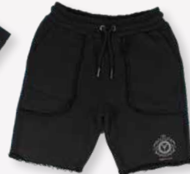
T-shirt & short