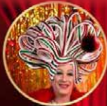
BABS voor 1 dag (na goedkeuring gemeente)