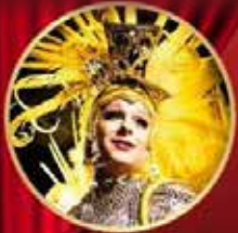
Opening van een winkel/restaurant