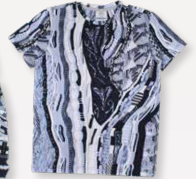
Trui & t-shirt