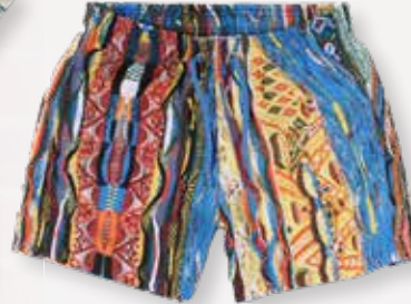
Polo & zwembroek