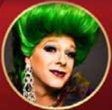
Entertainment op locatie (festival/verzorgings- tehuis/braderie/etc.)