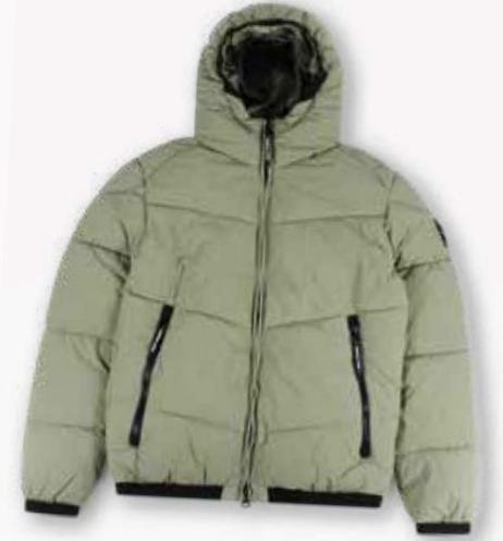
Marshall Artist winterjas