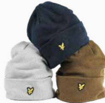
Lyle & Scott mutsen