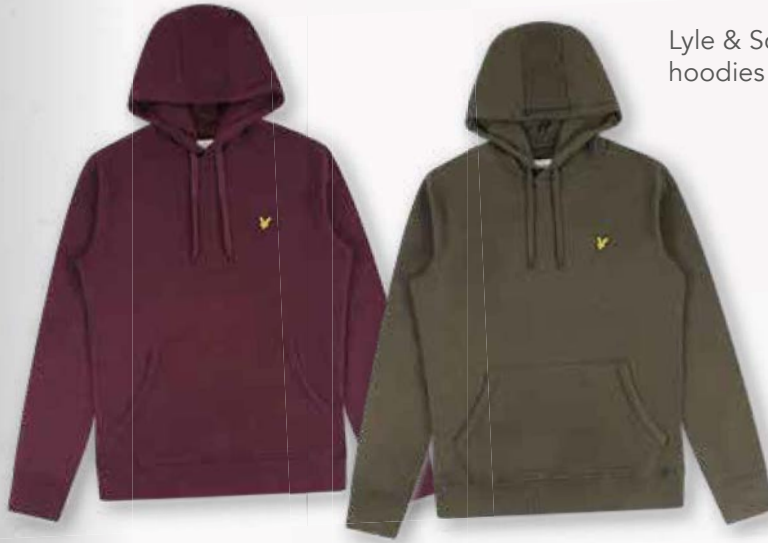
Lyle & Scott hoodies