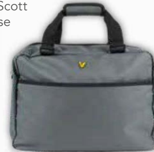
Lyle & Scott briefcase