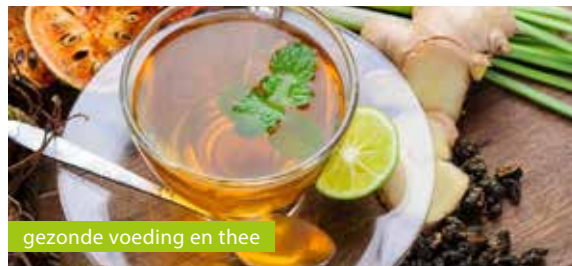
gezonde voeding en thee

Hét adres voor goed advies en diverse therapeuten o.a.: Bodyscan, Bio resonantie, Schoonheidssalon, Energetische Massages en Hypnotherapie.