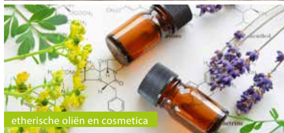
etherische oliën en cosmetica