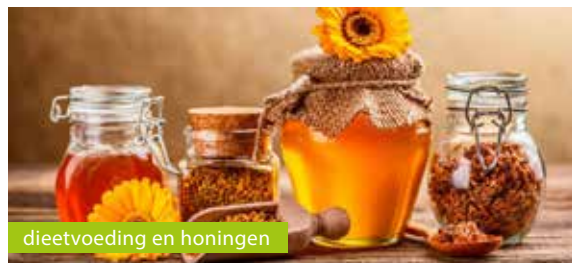
dieetvoeding en honingen