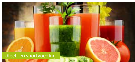
dieet- en sportvoeding