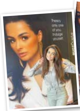
NA DE BEHANDELING