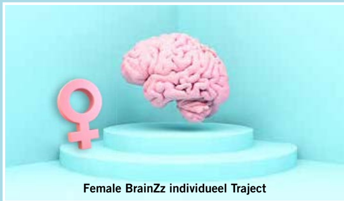
Female BrainZz individueel Traject

Dé tweedaagse offline training (hier in mijn praktijk), waarin je leert hoe je brein werkt, jouw gedragspatronen te herkennen en blijvend te veranderen.