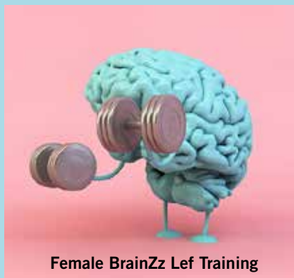
Female BrainZz Lef Training

Hét unieke, individuele zelfontwikkelingsprogramma op maat voor een leven vol geluk. Specifiek gericht op het vrouwenbrein.