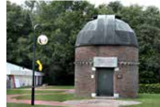
Sterrenwacht Jan Paagman

Za 9 april. Van 10.30 tot 14.00 uur zomerkleding en speelgoed. Entree € 1,- boven de 12 jaar. In BMV Hart van Heuze, Pastoor Arnoldstraat 2, Asten-Heusden.