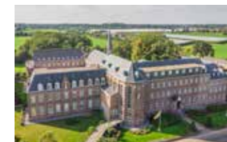
Missieklooster Aarle-Rixtel

Deze nieuwe wandelroute van 13 km start en eindigt bij het Missieklooster Heiligbloed in Aarle- Rixtel en voert o.a. langs kasteel Gemert. www.landvandepeel.nl/ kloosterrondwandeling.