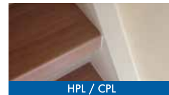
HPL / CPL

Wij werken met verschillende soorten materialen, zoals eikenhout, pvc en HPL/CPL, om je trap weer veilig, mooi en slijtvast te maken. Naast ledverlichting voor de trap hebben we ook bijpassend laminaat en trapeleuningen in rvs of (blauw)staal.