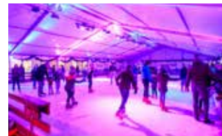
Schaatsbaan Helmond, De Vaste Clique