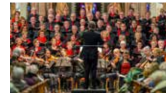
Puur Sangh, Asten

18 dec. Aanvang 20.00 uur in De Pandoer, Vorstermansplein 24 in Asten-Heusden. Entree gratis. Organisatie: Peelvrujters. Tel.: 0610306739