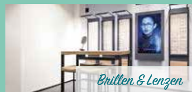
Brillen & Lenzen

Geïnteresseerd? Maak een afspraak op onze website of kom langs in onze optiek!