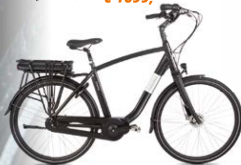
Fongers Livorno men 522 Wh € 2.699,- nu € 1699,-