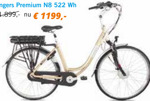
Fongers Premium N8 522 Wh € 1.899,- nu € 1199,-