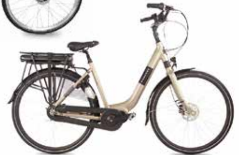
Fongers Superior 522 Wh € 2.899,- nu € 1999,-