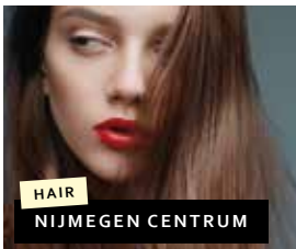
HAIR NIJMEGEN CENTRUM

Hertog Eduardplein 4 6663 AN Nijmegen – Lent Telefoon: 06-26791283 Van der Valk Hotel Nijmegen – Lent