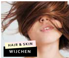
HAIR & SKIN WIJCHEN

Van Welderenstraat 71 6511 MD Nijmegen Telefoon: (024) 360 31 10