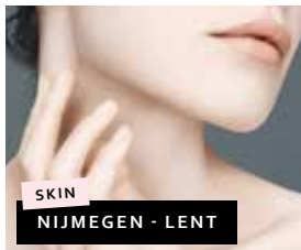
SKIN NIJMEGEN - LENT

Ieder mens bezit een individuele innerlijke en uiterlijke schoonheid. Die willen wij graag onderstrepen. Wij kijken goed naar jou, onze klant: gezichtscontouren, ogen, maar ook uitstraling en huidkwaliteit. Individueel advies en samen tot een uitgebalanceerde diagnose komen om vervolgens jouw kapsel en huidconditie aan te passen aan je persoonlijke wensen, dat is onze specialiteit. In onze salon in Wijchen zijn wij ook gespecialiseerd in het aanbrengen van permanente make-up.