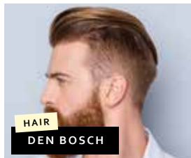
HAIR DEN BOSCH

Elckerlycweg 20 6602 HJ Wijchen Telefoon: 024-6419190