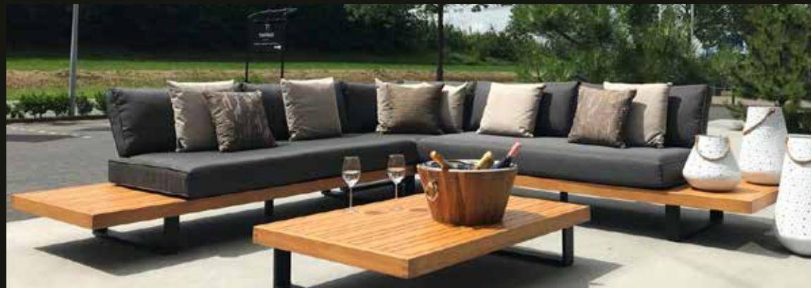
Modulaire loungeset CALMA, bestaande uit chaise longue links en rechts 231 x 88,5 cm, hoekdeel 88,5 x 88,5 cm, rechthoekige tafel 137 x 88,5 cm, vierkante tafel met kussen, te gebruiken als poef 88,5 x 88,5 cm. Tussenstuk 88,5 x 88,5 cm, ook te gebruiken als losse stoel. Poef en tussenstuk samen te gebruiken als 1 persoons ligbed.