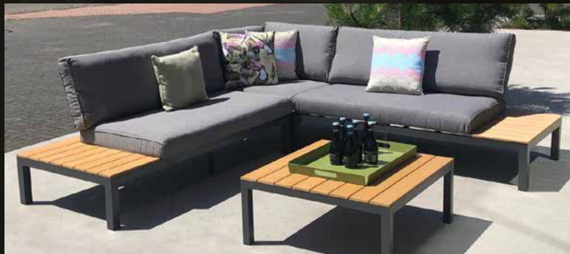
Michigan 4-delige loungeset. Gepoedercoat aluminium met polywood (teak kleur). Hoekopstelling 249 x 249 cm, tafel 80 x 80 cm. Deze set is eenvoudig zelf te monteren.