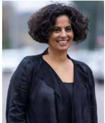
Met dank aan Beauty en Lifestyle Portraits voor de make-up en de foto.