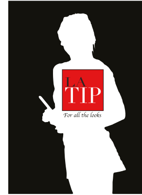
STYLING • HAIR • MAKE UP ARTIST

Gebruik altijd een kwalitatieve mascara die niet brokkelt. Of laat nepwimpers plaatsen, voor een nóg feestelijkere look. Besteed ook de nodige aandacht aan de wenkbrauwen, want deze bepalen de uitdrukking van je gezicht. Borstel ze in model en zet ze aan met een wenkbrauwpotlood.