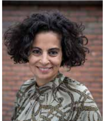
Met dank aan Beauty en Lifestyle Portraits voor de make-up en de foto.