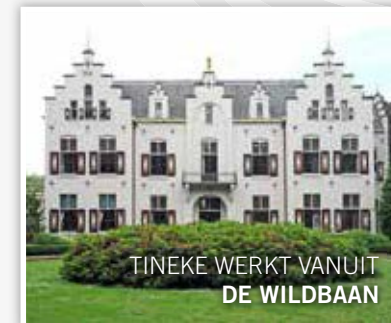
TINEKE WERKT VANUIT DE WILDBAAN

Heb je behoefte aan een goed gesprek, mail mij dan op t.veenstra@kernkracht10.nl