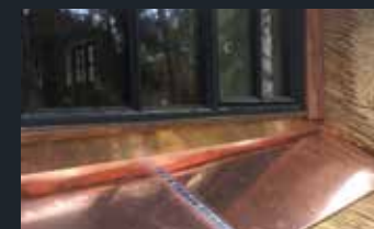
ZINK- EN KOPERWERKEN