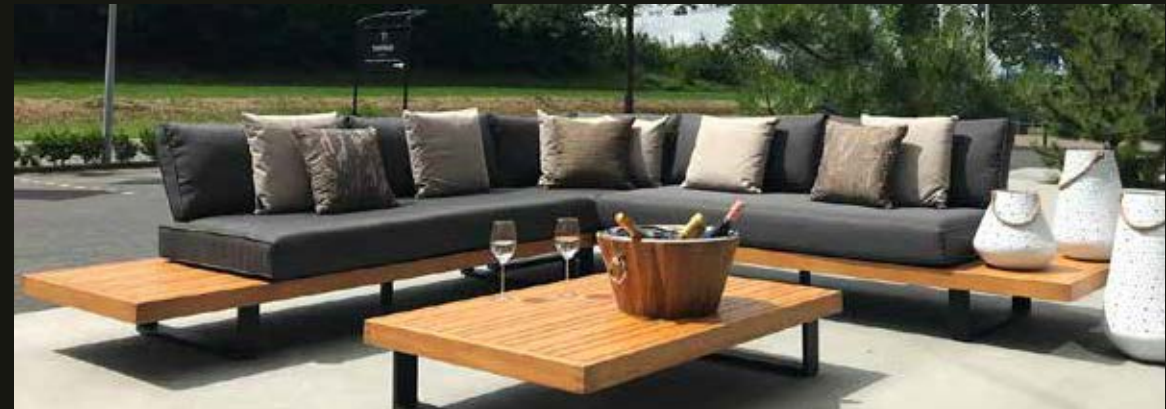
Modulaire loungeset CALMA, bestaande uit chaise longue links en rechts 231 x 88,5 cm, hoekdeel 88,5 x 88,5 cm, rechthoekige tafel 137 x 88,5 cm, vierkante tafel met kussen, te gebruiken als poef 88,5 x 88,5 cm. Tussenstuk 88,5 x 88,5 cm, ook te gebruiken als losse stoel. Poef en tussenstuk samen te gebruiken als 1 persoons ligbed.