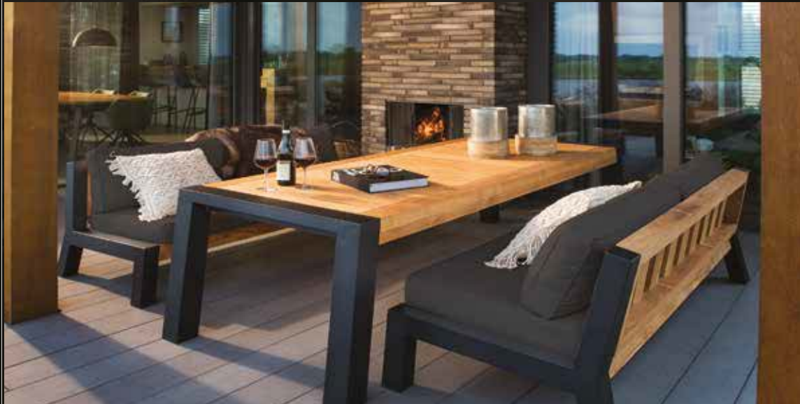
Bellevue low dining set, gepoedercoat aluminium frame gecombineerd met teakhout. De tafel is 240 x 100 x 67 cm. De banken zijn 200 cm breed.

Mooie comfortabele en betaalbare tuinmeubelen. Een kleurrijke collectie met oog voor detail. Design meubelen voor ieder budget. Kom naar onze mooie showroom en laat u informeren en inspireren!