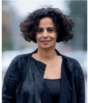
Met dank aan Beauty en Lifestyle Portraits voor de make-up en de foto.