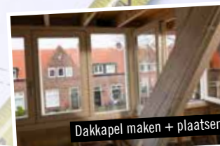
Dakkapel maken + plaatsen

Radek Legal heeft een top verzekeringspakket. Onverhoopte ongevallen zijn altijd volledig gedekt.