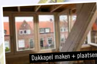
Dakkapel maken + plaatsen

Hartelweg 11, Breda | 06-51587229 | www.radeklegal.nl