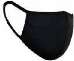
katoenen mondmaskers in diverse kleuren