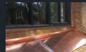
ZINK EN KOPER WERKEN