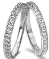
R.722 € 24,50