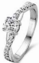
R.603 € 45,00