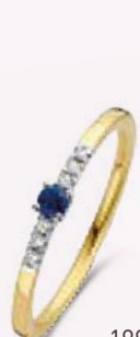
199.801 | Dia 0.06 € 545,00