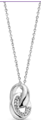
H.612 € 45,00