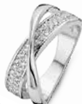
R.455 € 55,00