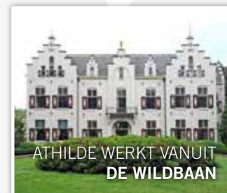
ATHILDE WERKT VANUIT DE WILDBAAN