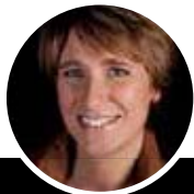
MARIAN EN MIRANDA

No. 28 wonen & lifestyle | Nieuwstraat 28 Dordrecht | 078 8431491 Statenplein 27 Dordrecht | 078 7853445 | info@no28.nl | www.no28wonen.nl