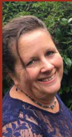
Psychosociale therapie en hulp in familierelaties