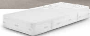
SF Hybrid 26 matras