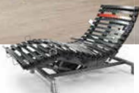
Uni-Bridge 22 lattenbodem