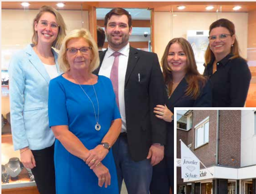
HET TEAM VAN JUWELIER SCHUTE STAAT VOOR U KLAAR.