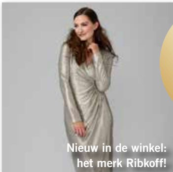
Nieuw in de winkel: het merk Ribkoff!

De mooiste kleding voor elke gelegenheid!