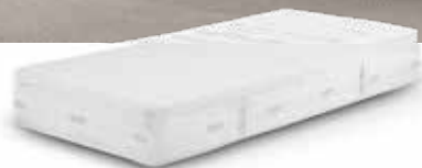
SF Hybrid 26 matras