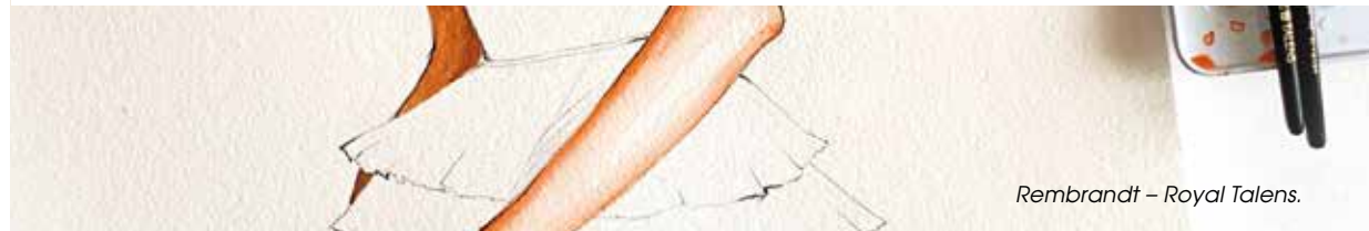
Rembrandt – Royal Talens.

Naast alom bekende namen als Winsor & Newton, Rembrandt, Caran d'Ache en Faber Castell kunt u hier ook terecht voor bijzondere, kwalitatief hoogstaande merken als Blockx, Sennelier en Escoda. Een overgroot deel van het aanbod is ook in de webwinkel terug te vinden.