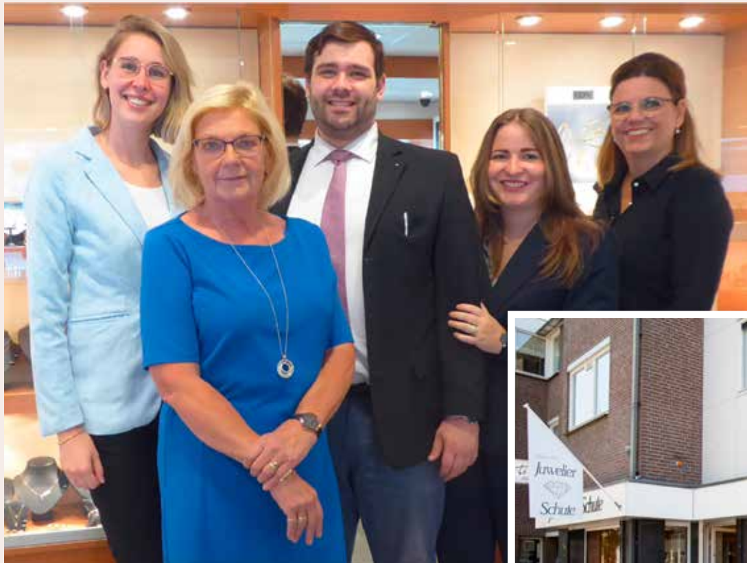
HET TEAM VAN JUWELIER SCHUTE STAAT VOOR U KLAAR.