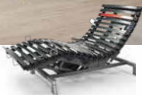
Uni-Bridge 22 lattenbodem