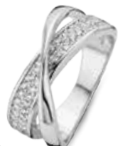
R.455 € 55,00