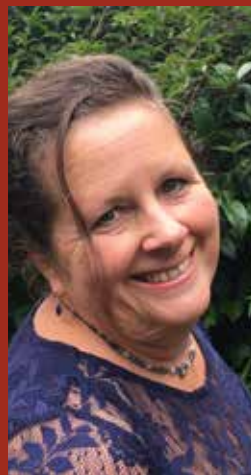
Psychosociale therapie en hulp in familierelaties

U krijgt voor een deel vergoeding als u aanvullend verzekerd bent bij een groot aantal verzekeraars.