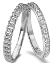
R.722 € 24,50