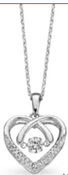
H.429 € 49,00