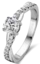
R.603 € 45,00