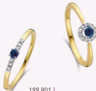
199.801 | Dia 0.06 € 545,00