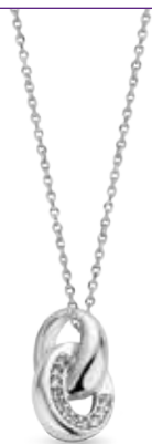
H.612 € 45,00