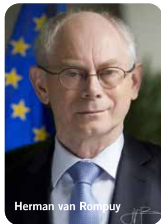
Herman van Rompuy

Het actuele Uitzpunt van Oisterwijk is dagelijks te bewonderen via www.oisterwijknieuws.nl/agenda