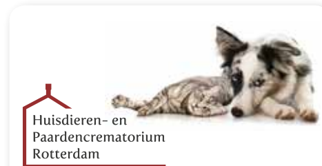
Huisdieren- en Paardencrematorium Rotterdam

Liet zich door mijn driejarige dochter ondersteboven meedragen en door haar grote zus aankleden en in het poppenbed leggen. Een keer was ze een paar dagen zoek, gelukkig kwam ze terug. Een paar weken later toonde ze vol trots haar drie jonkies die ze in de mand tussen de schone was had gelegd! Later werd ze erg ziek: een ontstoken baarmoeder en eierstokken. De risicovolle operatie ging gelukkig goed en Poes herstelde. Ze lag bij mijn dochters op het bureau tijdens het studeren en bij mij over mijn toetsenbord als ik moest werken. Ze is twee keer mee verhuisd, zag andere huisdieren komen en gaan en zag de meiden het huis uit gaan. Bijna 19 jaar werd ze. Gelukkig is ze maar even ziek geweest en rustig ingeslapen. Ik mis haar erg. Iedere keer als ik het urntje zie staan, denk ik aan haar.