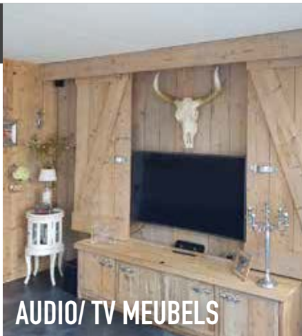
AUDIO/ TV MEUBELS

STEIGERHOUTEN MEUBELS VOOR PARTICULIEREN EN BEDRIJVEN