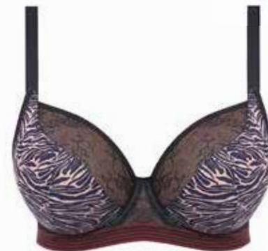
Plunge BH Freya Wild € 51,95