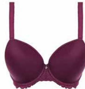
Voorgevormde BH Fantasie Memoir € 62,95