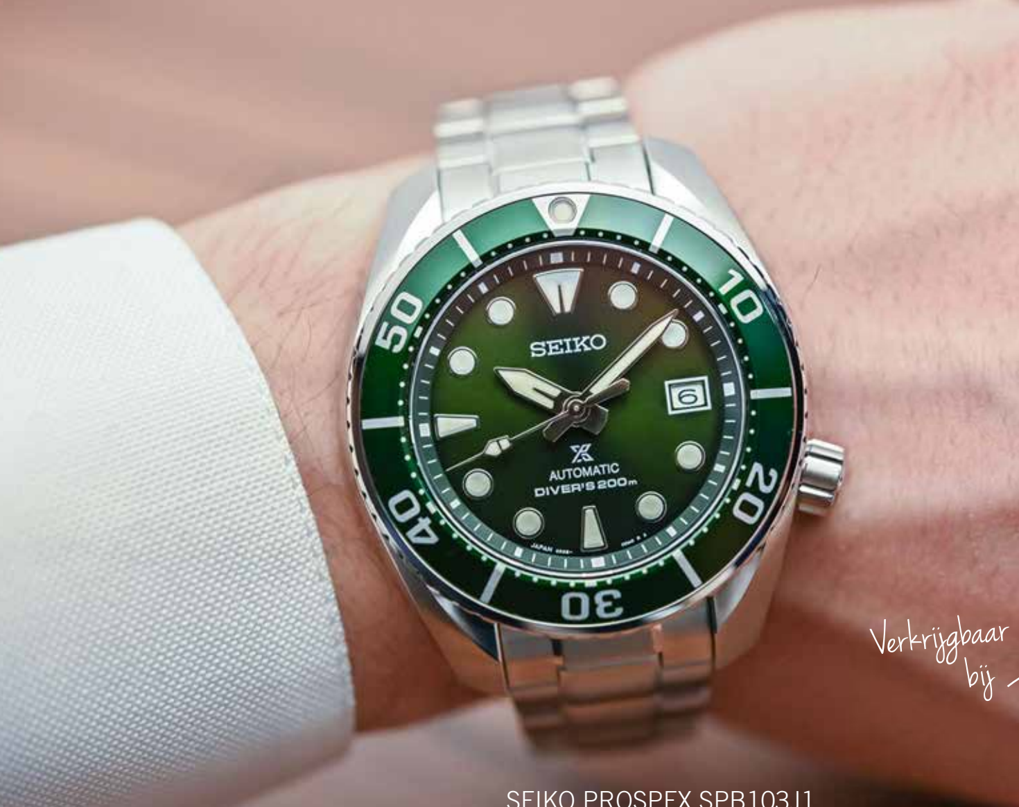
SEIKO PROSPEX SPB103J1