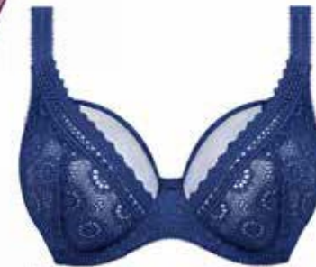
Plunge BH Freya Love Note € 46,95