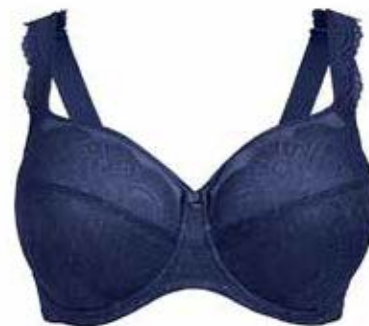
Hele cup BH Rosa Faia Selma € 69,95