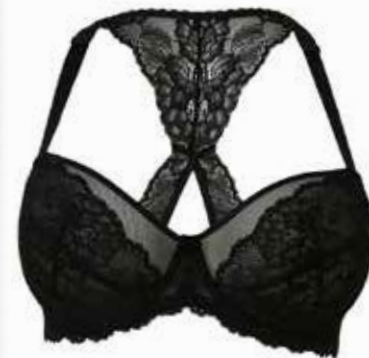
Hele cup BH Plaisir Valentine € 64,95