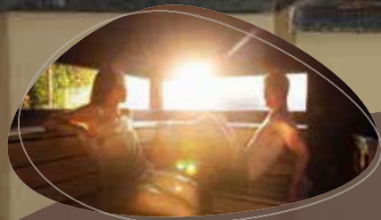
8 heerlijke sauna's