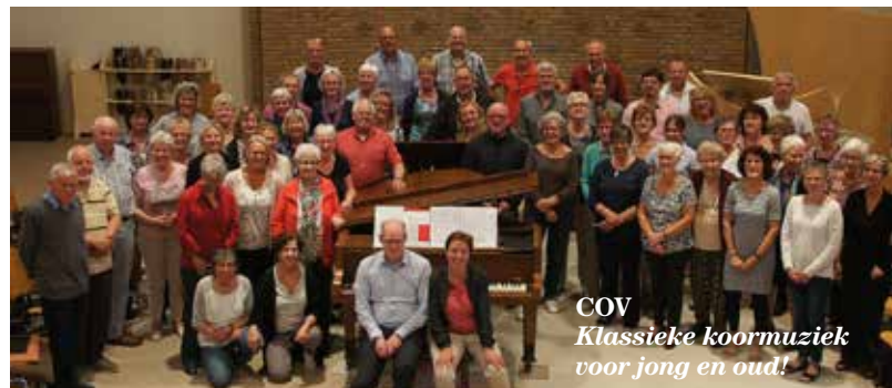
COV Klassieke koormuziek voor jong en oud!

Vóór aanvang in de kerk en via e-mail: info@covz.nl .