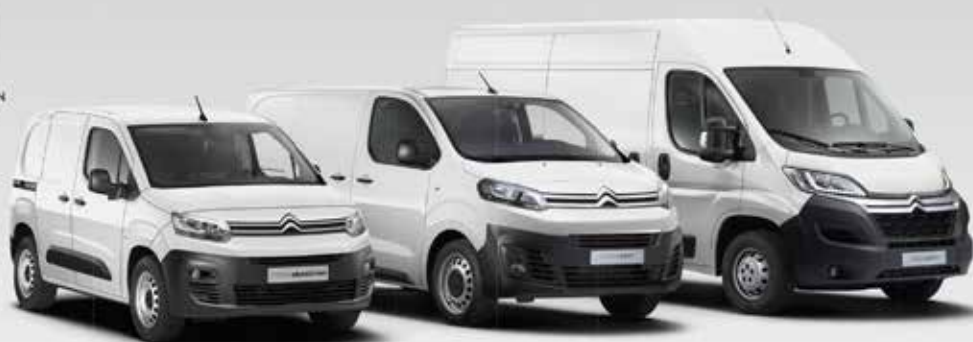
NIEUWE CITROËN BERLINGO VAN 20 rijhulpsystemen