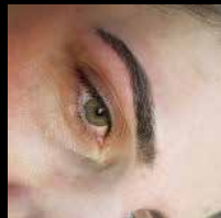
The Tinted Brow

Bij Backstage Brows kun je terecht voor diverse treatments: