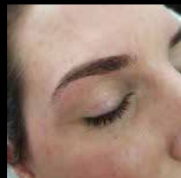
The Backstage Brow

Daarnaast biedt Backstage Brows ook lash lifting, de ideale manier om een permanente krul in de wimpers aan te brengen.