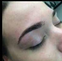
The Henna Brow