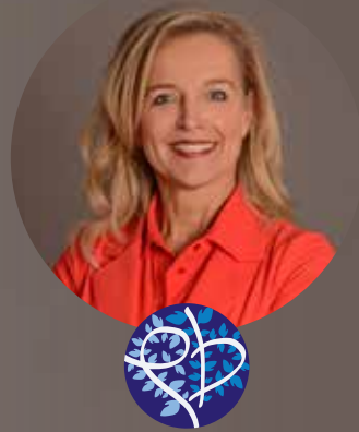
Els Uitvaartzorg Els Barnhoorn

Tussendoor worden er herinneringen opgehaald. Aan het einde van de middag brengt de groep vrienden hem weer terug naar het rouwcentrum. Iedereen is onder de indruk van dit bijzondere afscheid.