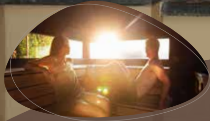
8 heerlijke sauna's