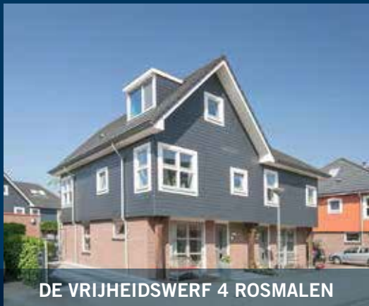
DE VRIJHEIDSWERF 4 ROSMALEN

KOM WONEN op een heerlijk eiland in deze complete en mooi gesitueerde tweekapper! Woonoppervlakte: 145 m 2 Perceel: 166 m 2 en 15 m 2 vlonder Bouwjaar: 2005 Vraagprijs: € 429.000,- kk