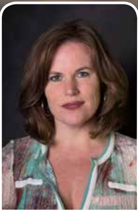
'Creëer innerlijke rust'

Door het trainen van de aandacht word je bewust van je lichaam, gedachten, gevoelens en 'automatische' patronen, zonder te oordelen. Met aandacht kun je bewust kiezen om hier in mee te gaan of om dit te doorbreken. Door (on)bewuste overtuigingen en (emotionele) patronen te herkennen en te doorbreken, creëer je meer innerlijke ruimte en rust om bewust te antwoorden en de juiste keuzes te maken die bij je passen.