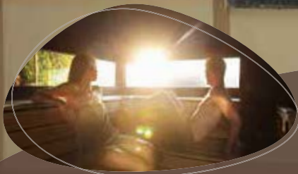
8 heerlijke sauna's