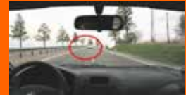
Vrij zicht door ontbreken van de navigatie.

Het risico op een ongeval met dodelijke afloop is voor een motorrijder 20 keer groter dan voor een automobilist. Is de motorrijder dood, wordt het jouw levenslange trauma als betrokken automobilist, ongeacht de schuldvraag.