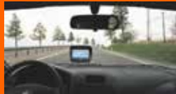
Zicht belemmerd door de navigatie.