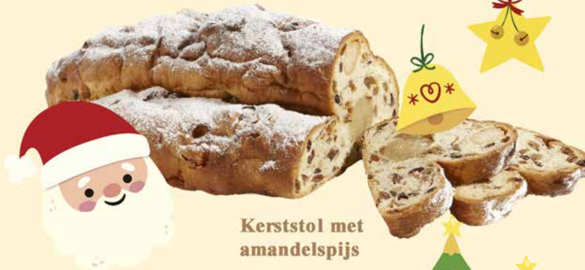
Kerststol met amandelspijs