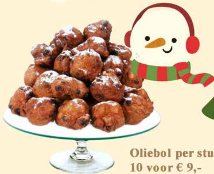
Oliebol per stuk € 1,- 10 voor € 9,-