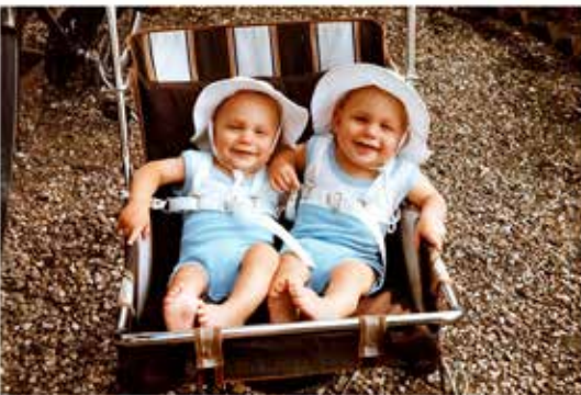
This is me This is me