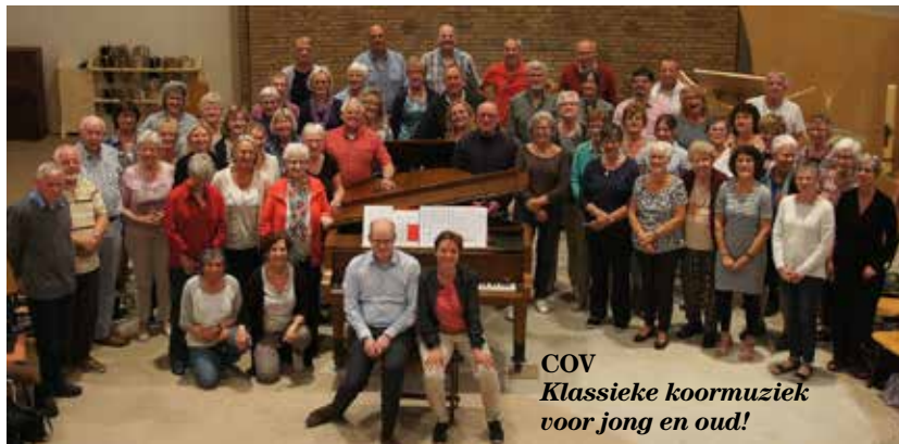
COV Klassieke koormuziek voor jong en oud!

Entreprijzen: € 27,50; jongeren t/m 16 jaar, CJP en ISIC € 15,-