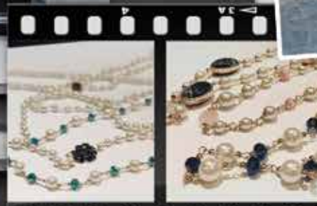
Edward Achour sieraden